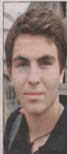
Zolić: Procedura nije komplikirana

- Dodatno sam se informirao i donio odluku da